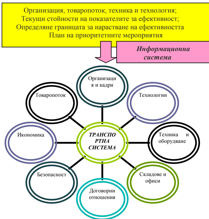
Фиг.1 Етапи и функционални области на логистичния одит

Фигура 1. показва стъпките и части за анализ по този т.н. логистичен одит. Необходимата информация за изготвянето му е: